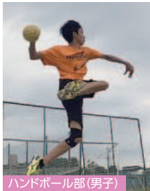
ハンドボール部 (男子)