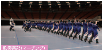
吹奏楽部 (マーチング)